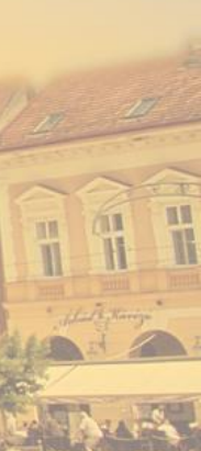
A napba öltözött város