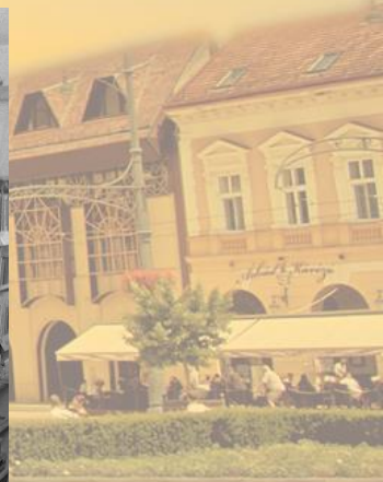
A napba öltözött város