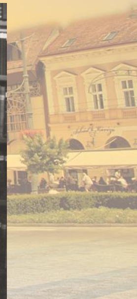
A napba öltözött város