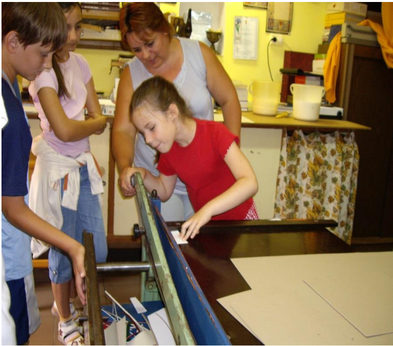
Látogatás a Könyvkötőnél