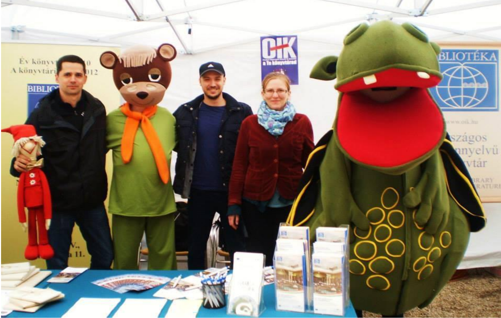
A Könyvtáros kollégák Süsüvel és Tévémacival az OIK sátrában. Múzeumok Majálisa 2014.